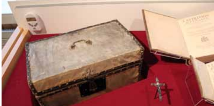
Mallette de voyage et crucifix ayant appartenu à Marguerite Bourgeoys, avant leur restauration. (Collection de la Congrégation de Notre-Dame, Musée Marguerite-Bourgeoys.)